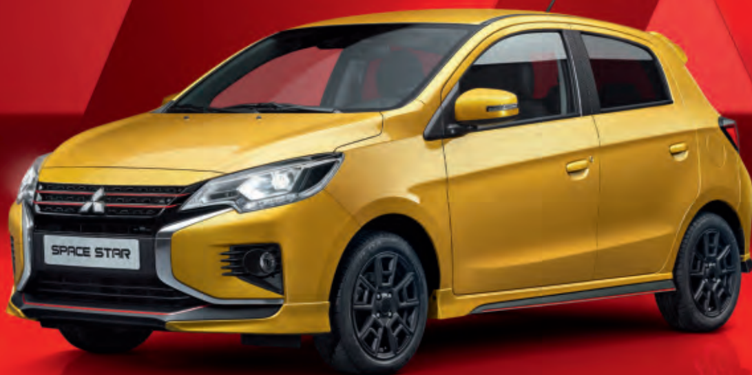
Abb. zeigt Serienfahrzeug mit nachträglich angebrachtem Zubehör